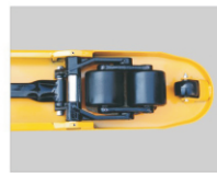
رولرهای ورودی جهت عملکرد آسان و طراحی نوین مجموعه چرخهای جلو