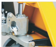
ظرفیت پمپ قابل تنظیم