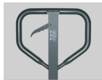
دستگیره با روکش کاملاً لاستیکی