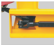
محور قابل تنظیم